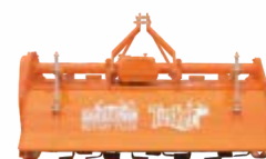
Tusker Rotary Tiller