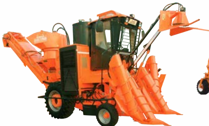
Sugarcane Harvester - Shaktiman 3737