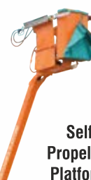
Self Propelled Platform