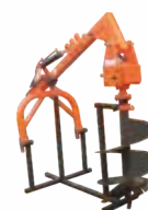
Post Hole Digger