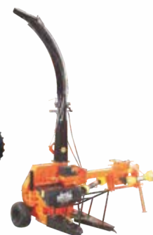
Mobile Shredder/ Fodder Harvester