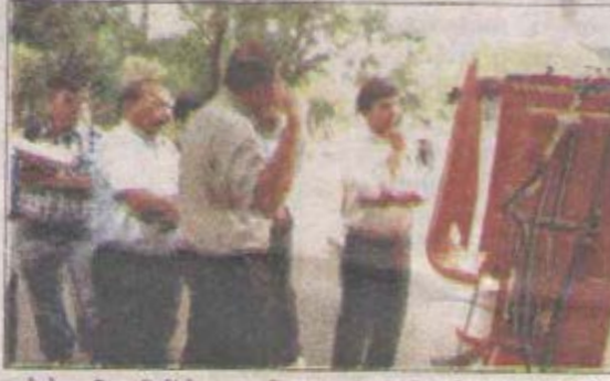
एग्री के अधिकारियों ने बताया कि चालक ही पूरी तरह से आपरेट

यह प्लेटफॉर्म बतौर ट्रायल राजकोट गुजरात की तीर्थ एग्री टेक्नोलॉजी प्रा.लि. द्वारा एक सप्ताह के लिये नगर निगम भोपाल को उपलब्ध कराई गई है. नगर