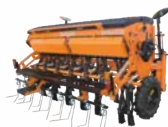
Mechanical Seed Drill 300