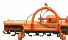
Side Shift Rotary Tiller