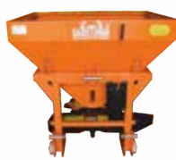
Square Fertilizer Broadcaster