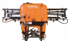
Rakshak 400 - Tractor Mounted Boom Sprayer