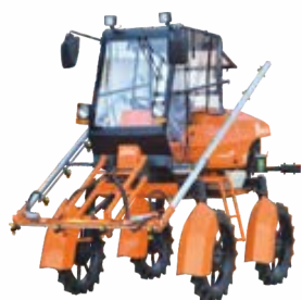
PROTEKTOR 600 - Self Propelled High Clearance Boom Sprayer