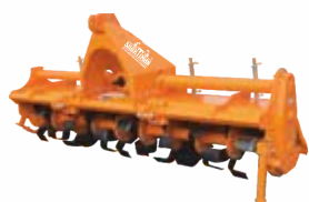
SHAKTIMAN ROTARY TILLER®