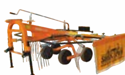
Hay Rake-SRHR 3.5/9