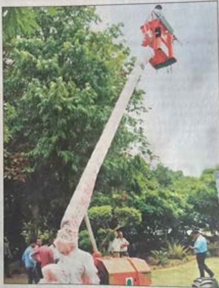
The machine was first operated in Nehru Park on Friday.

The technology is being specially developed by dedicated firms to suit the needs of the civic body. "These machines have a high reach and can also be used for other purposes. It has been designed to take care of other jobs such as trimming the plants around roadsides and gardens,