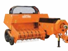
Square Baler - Bale Master 150