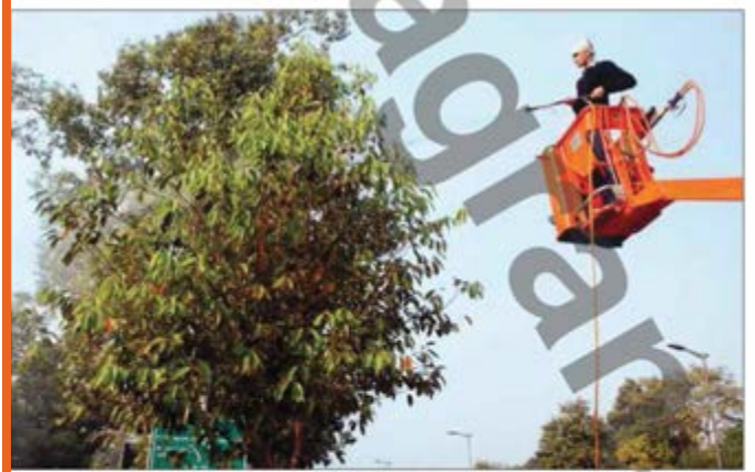
मशीन से खतरा के बिना एम्प्लॉयमेंट डेवेलपमेंट सेक्टर में पेड़ों की हो रही सफाई।